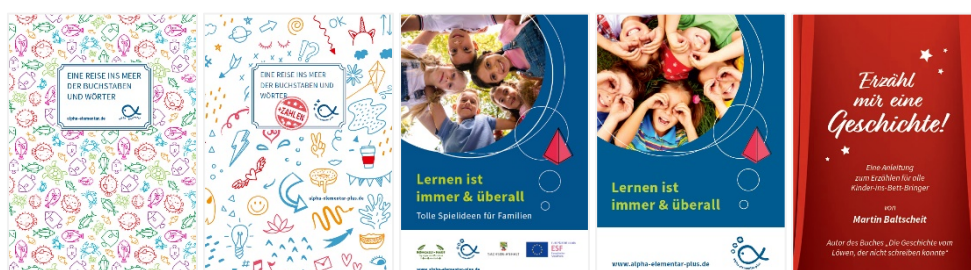
Broschüre „Eine Reise ins Meer der Buchstaben und Wörter“ / Broschüre „Eine Reise ins Meer der Buchstaben, Wörter und Zahlen“ / Broschüre „Lernen ist immer & überall – Tolle Spielideen für Familien“ / Flyer „Lernen ist immer & überall“ / Flyer „Erzähl mir eine Geschichte! – Eine Anleitung zum Erzählen für alle Kinder-ins-Bett-Bringer“

Nachdem die Projektarbeit von „alpha elementar“ und später „alpha elementar plus“ nach fünf Jahren beendet wurde, stehen alle entwickelten Materialien ab sofort unter Materialiensammlung als Download zur Verfügung.