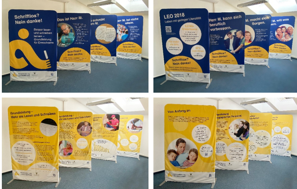
Die Landesausstellung Alphabetisierung und Grundbildung Sachsen-Anhalt mit angepassten Inhalten; Vorder- und Rückseite als Set mit 8 Aufstellern